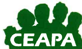
Confederación Española de Asociaciones de Padres y Madres de Alumnos