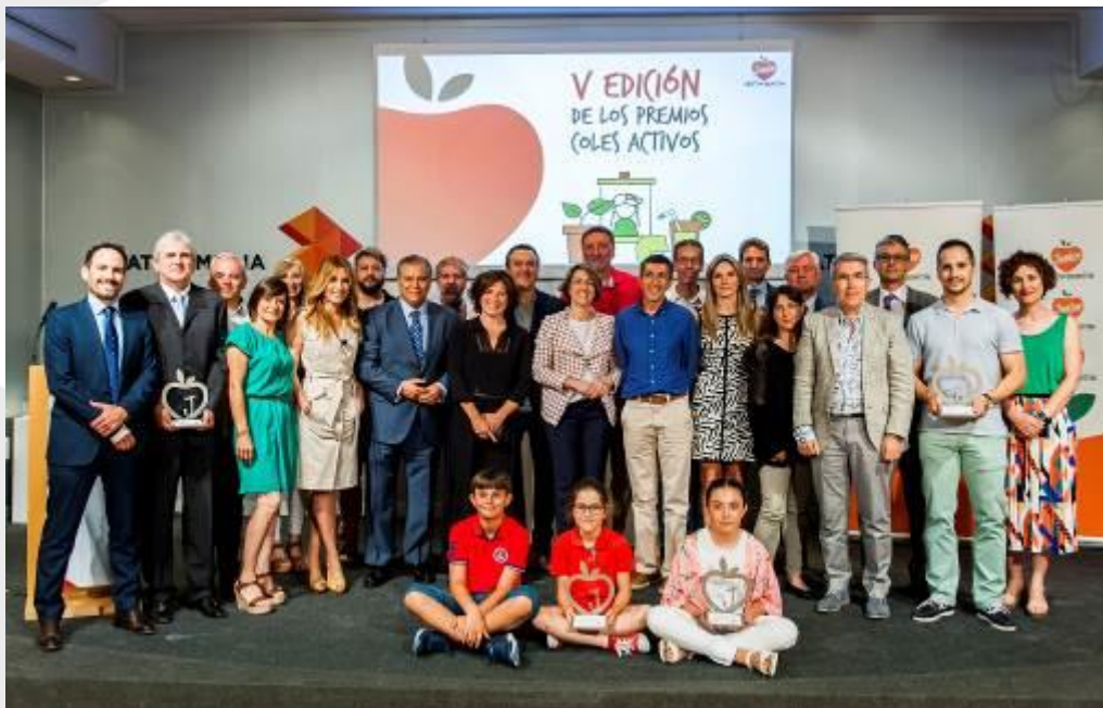
Foto de familia de la entrega de Premios celebrada el año pasado

El CEIP Cisneros de Santander (Cantabria), el Colegio Enrique Soler de Melilla, el CEIP Claudio Sánchez Alborno de Almansa (Albacete) y el CEIP Benito Pérez Galdós de Miguelturra (Ciudad Real), éstos últimos empatados en el tercer premio, fueron los galardonados el año pasado.